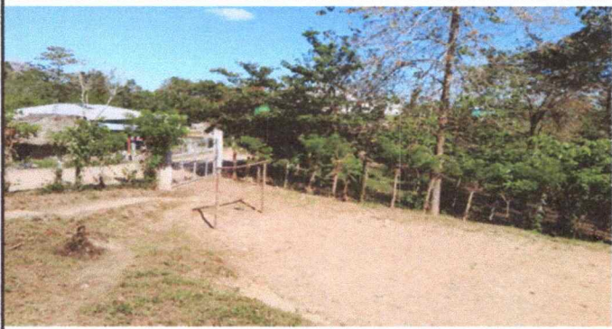
Foto 1: Mantenimiento de circulación del predio del Establecimiento